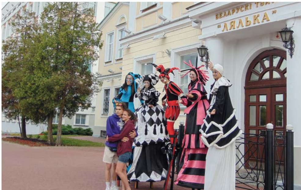
Фото на память с артистами