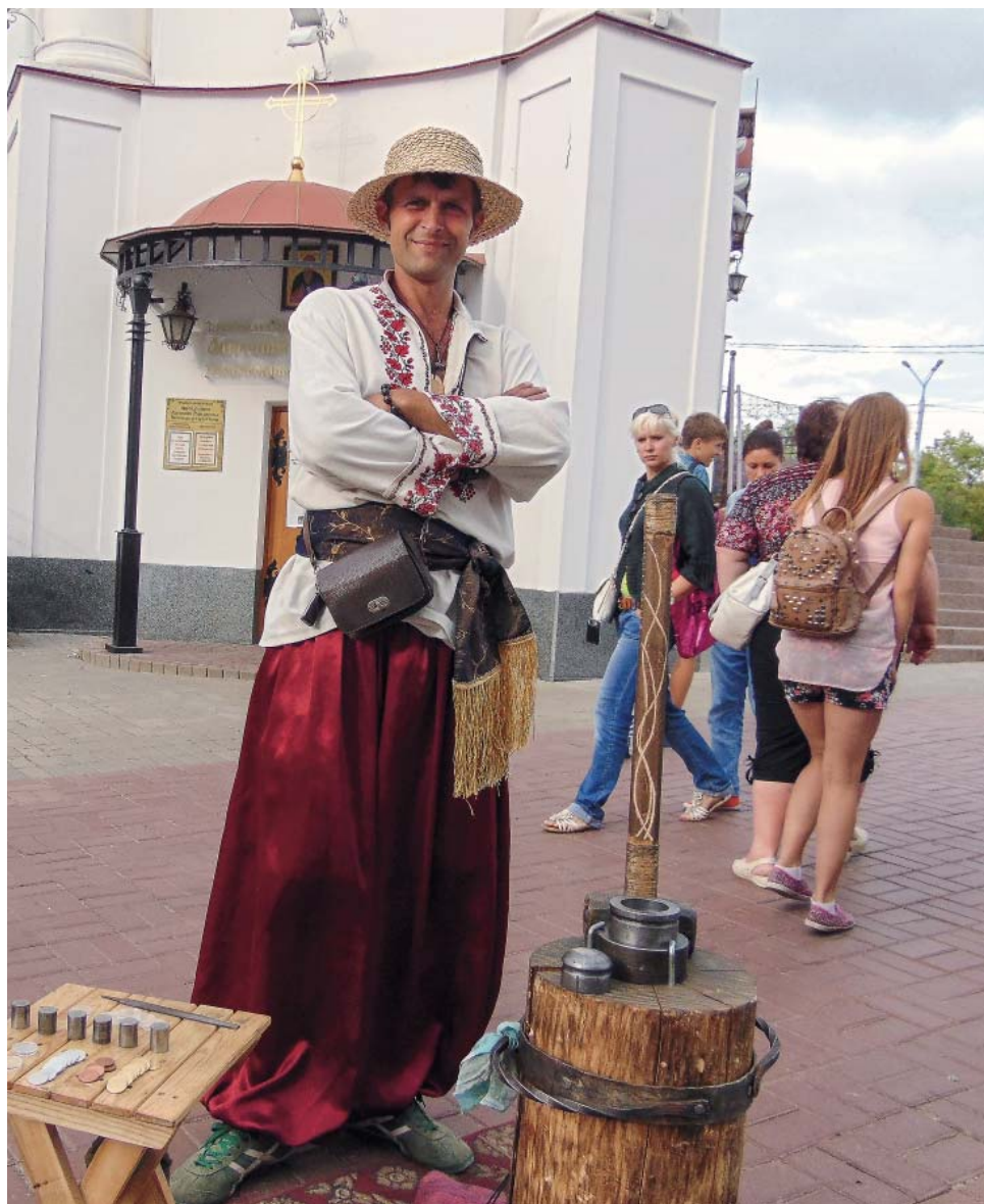
В городе мастеров