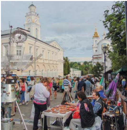
Витебск в дни фестиваля