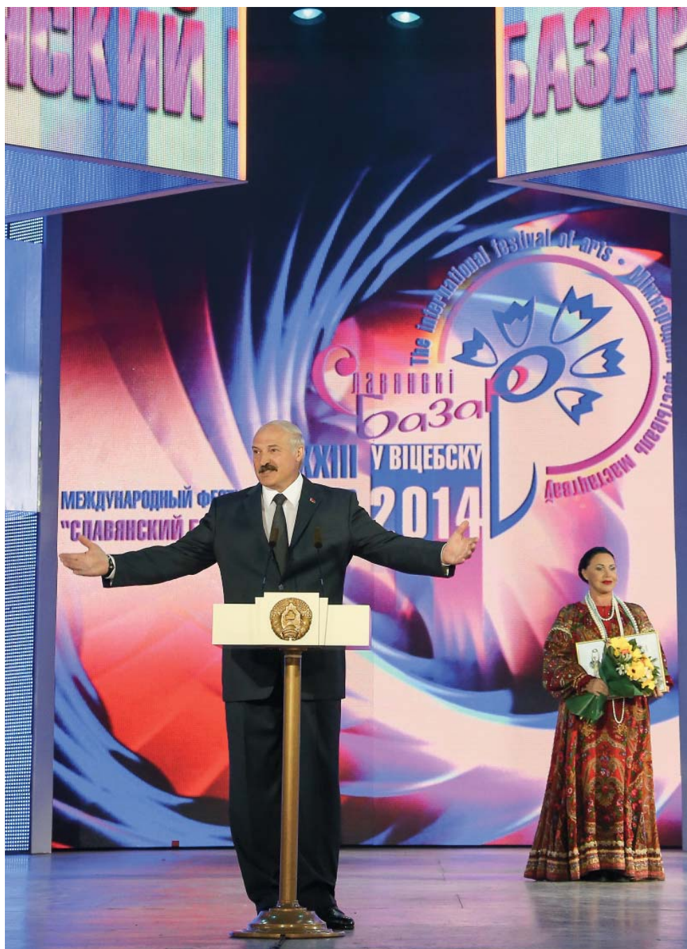
Президент Беларуси Александр Лукашенко: «Добро пожаловать!»

Вообще программа 23-го форума искусств была насыщенной. Началась она утром и заканчивалась с рассветом следующего дня. Ночные концерты звезд эстрады – тоже одна из особенностей «Славянского базара», зрители покидали зал Летнего амфитеатра, когда всходило солнце, а на сцене уже готовились к следующему представлению. В этом году с сольными программами выступили Филипп Киркоров, Стас Михайлов, Николай Расторгуев и группа «Любэ», Борис Моисеев, Олег Газманов, Хор Турец-