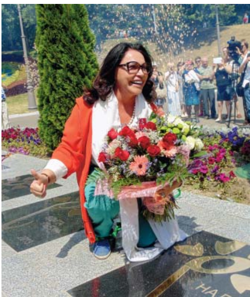
«Звезда» Надежды Бабкиной